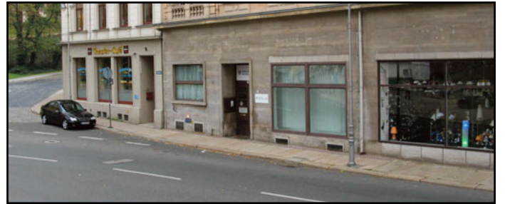
Das Jugendamt des Landkreises am Theaterplatz in Altenburg.

Altenburg. Seit Montag, 14. März 2022, stehen Bauarbeiten auf dem Hof des Verwaltungsstandorts Theaterplatz 7/8 und dem Nachbargrundstück Theaterplatz 6 an. Dadurch kommt es im Bereich Theaterplatz zu Verkehrseinschränkungen durch ein- und ausfahrende Baufahrzeuge. Davon wird auch der Gehweg tangiert. Für die Zeit der Bauarbeiten, die bis 31. Mai 2022 geplant sind, werden Fußgänger deshalb gebeten, hauptsächlich den Gehweg auf der Theaterseite zu benutzen.