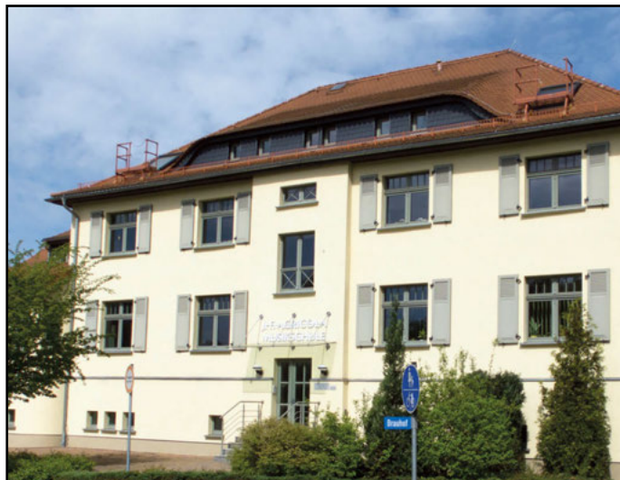
Der Schmöllner Standort der Musikschule Altenburger Land.

Die Musikschule bietet ab sofort neue Kurse an. So vermittelt der 45-minütige Kurs „Musikgeschichte für Jugendliche ab 14 und Erwachsene“ wöchentlich Interessantes zur historischen Entwicklung der Musik. Im Einzelunterricht können jetzt auch die Fächer Cembalo, Jazzpiano und Laute belegt werden. Kindern und Erwachsenen steht die Musikschule gleichermaßen offen. Anmeldungen und Auskünfte zur Ausbildung sind jederzeit möglich. Empfohlen wird die Online-Anmeldung auf der Webseite im Bereich Service. Kontakt ist auch möglich per E-Mail sowie telefonisch. JF