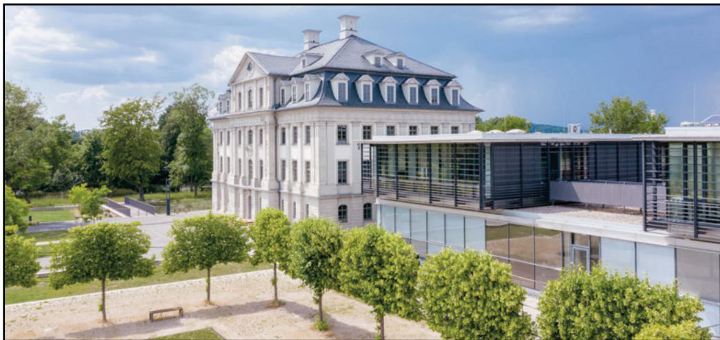
Der Campus in Gera an der DHGE kann zum Hochschulinformationstag besichtigt werden.

Nachdem die Ferienfreizeit 2020 wegen der Corona-Pandemie ausfallen musste, konnte in diesem Jahr wieder eine Fünftage-Ferienlager-Fahrt angeboten werden. Das Ziel der vier Betreuer und 25 Kinder im Alter von acht bis vierzehn Jahren war das Gelände des KiEZ "Am Filzteich" e.V. bei Schnee-