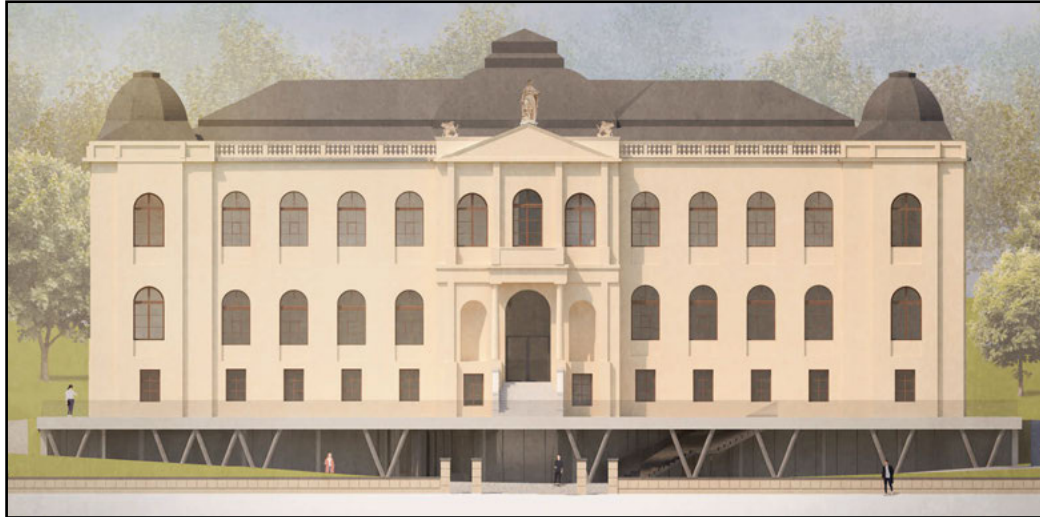
Der Entwurf von Architekt Markus Sabel hebt das historische Gebäude optisch auf einen Sockel.

Laut diesen erhält das Museum einen einladenden, funktionalen, repräsentativen und besucherorientierten Ankunfts-bereich. Der neue Eingang wird sich auf Bodenniveau befinden, das heißt auf der Höhe des ehemaligen Kellers. Dort entstehen ein Kassen- und Shop-Bereich, Besuchergarderoben und neue Sanitäranlagen. Alles ist dann barrierefrei zugänglich.