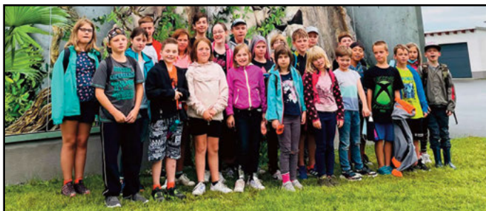
25 Kinder aus dem Landkreis genießen ihre Ferien im Erzgebirge.

Gleich am Montag stand dann für die Ferienkinder eine Runde Minigolf auf dem Plan. Anschließend zeigte sich die Sonne und die ersten Mädchen und Jungen trauten sich in den Filzteich zum Baden.