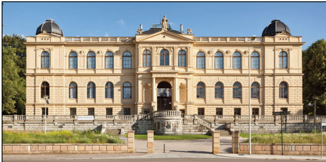
Der derzeitige Eingang ist ein Neubau aus dem Jahr 1910.