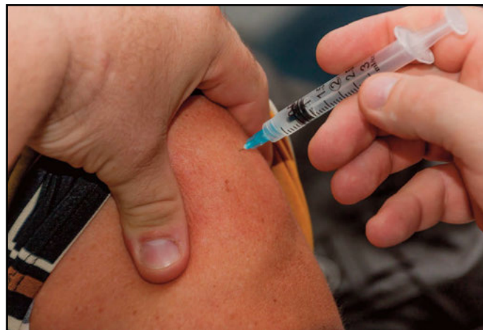
Ein kleiner Piks schützt vor Influenza.

Es sollten sich möglichst viele Menschen gegen Influenza impfen lassen. Besonders empfehlenswert ist dies für alle Personen ab 60 Jahre, für alle Schwangeren ab dem 2. Trimenon und bei erhöhter gesundheitlicher Gefährdung infolge eines Grundleidens ab 1. Trimenon, zudem für Personen mit erhöhter gesundheitlicher Gefährdung infolge eines Grundleidens wie zum Beispiel chronische Krankheiten oder Atmungsorgane, Herz- oder Kreislaufkrankheiten, Leber- oder Nierenkrankheiten, Diabetes oder andere