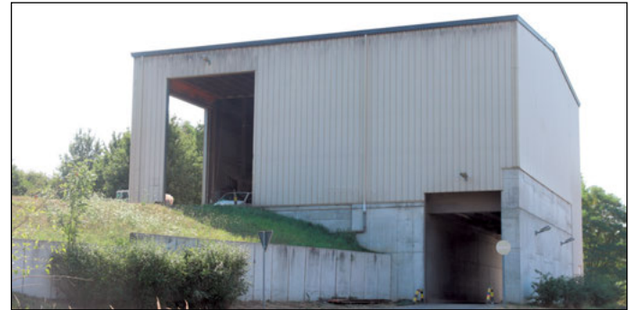
Die Umladestation auf dem Wertstoffhof in Altenburg.