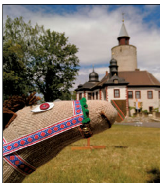
Das Steckenpferdturnier gibt's diesmal nicht bei Regen.