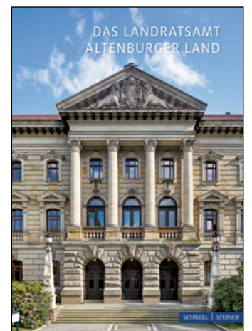
Die neue Broschüre gibt es auch zum Denkmaltag.

Durch die Zusammenarbeit mit dem Verlag Schnell & Steiner reiht sich diese Broschüre in die für Europa umfassendste Folge „Kleiner Kunstführer“ zu Kirchen, Klöstern, Schlössern, Burgen, Kunstlandschaften, Städten und Museen ein. Der Kunstführer zum Landratsamtgebäude kann ab sofort im Buchhandel unter der ISBN 978-3-7954-7178-1 zum Preis von 2,50 Euro erworben werden. Zum Tag des offenen Denkmals ist er im Landratsamt erhältlich. Luise Kruschke, Fachdienst Wirtschaft und Kultur