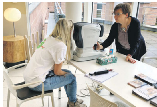
Verschiedene Aussteller präsentierten ihre Angebote im Foyer des Klinikums. Optiker Fielmann aus Altenburg vermaß die Sehstärke und beriet über Arbeitsplatzbrillen. Das Sanitätshaus Altenburg stellte verschiedene Geräte vor, mit denen sich die Besucher*innen 5 bis 10 Minuten entspannt massieren lassen konnten.