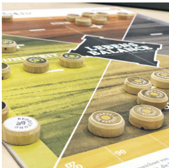
In kurzen Einzelberatungen untersuchte Prowandel Jena die Lebensbalance der Mitarbeiter*innen und gab ihnen hilfreiche Impulse für mehr persönlichen Ausgleich trotz alltäglichem Stress an die Hand.