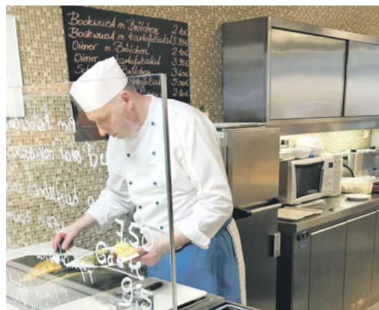
Das Team der Küche zauberte zwei Mal in dieser Woche ein leckeres Aktionsmenü, welches großes Lob erntete! Serviert wurde unter anderem ein frischer Quinoasalat, Zanderfilet und Obstsalat mit Walnüssen.