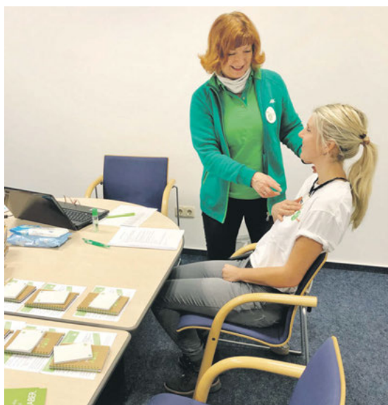
Das Rückencollege Zwickau stellte mit Hilfe der Medical Blue Stressmessung Interessierten ihr Stresslevel vor und gab Tipps für einen ausgeglichenen Alltag.

Vom 20. bis 24. Januar 2020 fand im Klinikum Altenburger Land die „Gesunde Woche“ für Mitarbeiterinnen und Mitarbeiter statt. Unter dem Motto „Wenn du dir wirklich wichtig bist, gibt es kein Aber“ wurden in diesen fünf Tagen zahlreiche Vorträge, Sportkurse und Workshops angeboten, die die Mitarbeiter*innen im Rahmen des Betrieblichen Gesundheitsmanagements besuchen konnten.