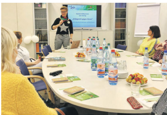
Das Team VitalAnja Chemnitz zeigte den Mitarbeiter*innen einen einfachen Weg zu einer gesunden Ernährung im Säure-Basen Gleichgewicht.