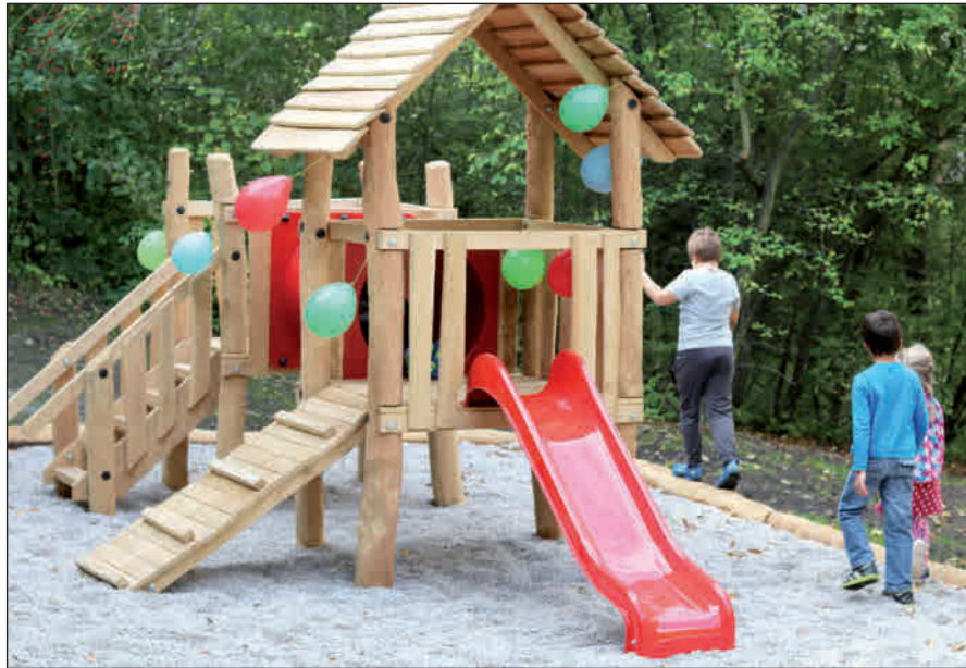
Gespannt und zunächst vorsichtig näherten sich die ersten kleinen Patienten dem neuen Spielplatz am Klinikum

In diesem Rahmen kam das Thema Spielplatz immer wieder zur Sprache. Ein Spielplatz ist auch