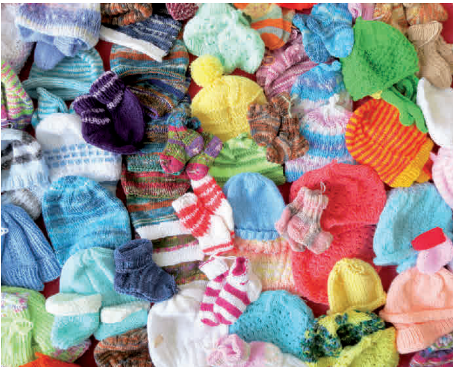
Die zuckersüßen Mützen und Söckchen in unterschiedlichen Größen und allen denkbaren Farben sind bei unseren Kleinsten genau an der richtigen Adresse.

Die Klinik für Frauenheilkunde und Geburtshilfe bedankt sich recht herzlich bei „Strickliesel“ Rositz und allen anderen Spenderinnen und Spendern für die zahlreichen Mützen und Söckchen, die in den letzten Wochen