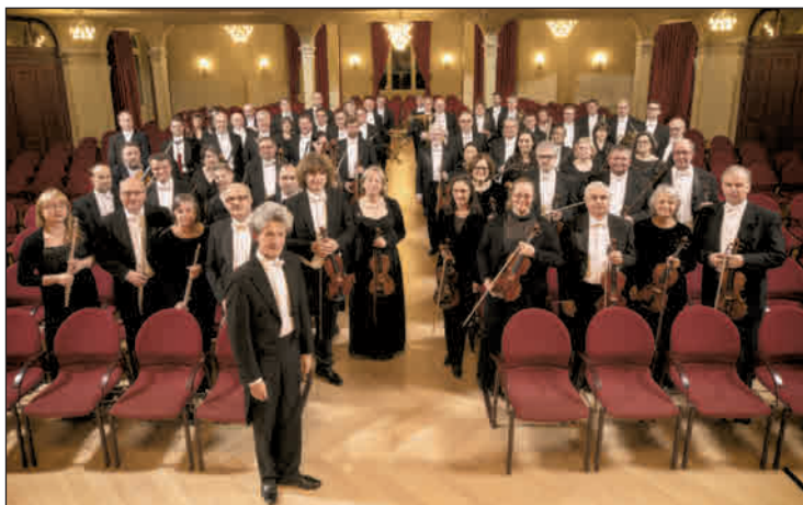
Philharmonisches Orchester Altenburg Gera.