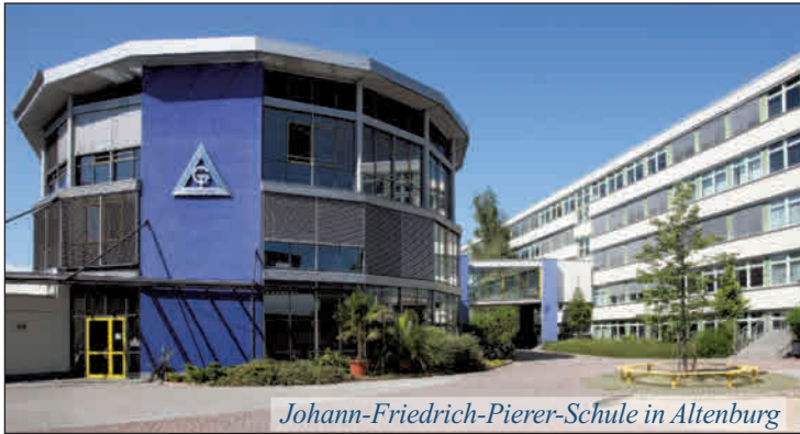
Johann-Friedrich-Pierer-Schule in Altenburg

An der Johann-Friedrich-Pierer-Schule erfolgt die Ausbildung der Berufsfachschüler in den Bereichen Technik und Ernährung. Das Ziel ist dabei nicht nur, die Schüler auf den Realschulabschluss vorzubereiten, sondern auch fit für den Berufsalltag zu machen. Alle Schüler erhalten eine berufliche Grundausbildung und haben nach zwei Jahren gute Vermittlungschancen in Ausbildungsbetriebe.