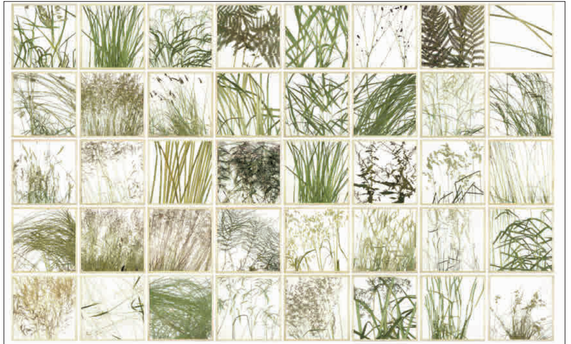
Foto links: Dem Künstler herman de vries gratulierten Ministerpräsident Bodo Ramelow und Landrat Uwe Melzer als erste offiziell zur Ernennung als Gerhard-Altenbourg-Preisträger 2019 (v.l.n.r.). Foto rechts: vegetation, 2007, organisches Material auf mit Papier kaschierten Platten.

bilder, Skulpturen, Künstlerbücher und Installationen für den öffentlichen Raum. Zudem beschäftigt er sich als Essayist und Philosoph auch theoretisch mit der Kunst. Der Zufall und die Veränderung definieren und strukturieren das weitverzweigte Werk des Künstlers. Seit 1970 lebt er zurückgezogen im unterfränkischen Eschenau, wenn er nicht gerade die entlegensten Orte der Welt bereist. Auf seinen ausgedehnten Streifzügen sammelt er Naturalien, die er zuhause archiviert, katalogisiert und, ohne ihr Aussehen zu verändern, zu Bildern erhebt. Die Arbeiten von herman de vries folgen einem umfassenden Kunstbegriff, der die Sinne und den Intellekt gleichermaßen anspricht und in Anspruch nimmt.