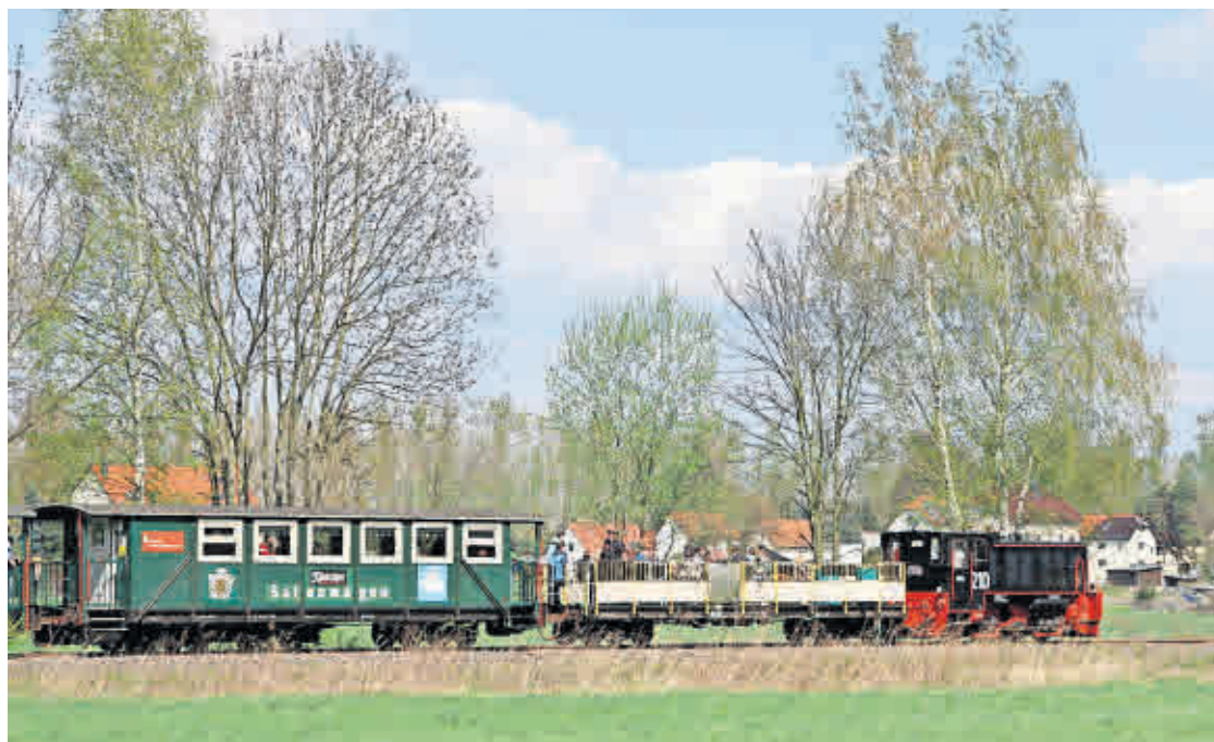
DIE KOHLEBAHN ZUCKELT sonntags wieder durchs Altenburger Land