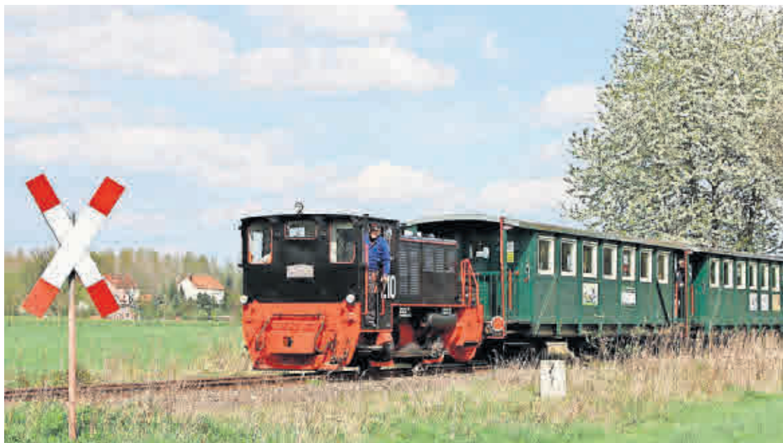
DER VEREIN KOHLEBAHNEN in Meuselwitz startet ab April Fahrten mit seinen Bimmelbahnen.