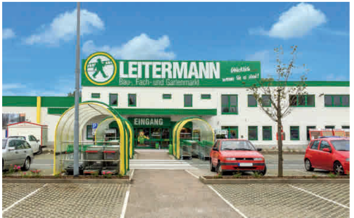
Eine der sieben Leitermann-Filialen heute.