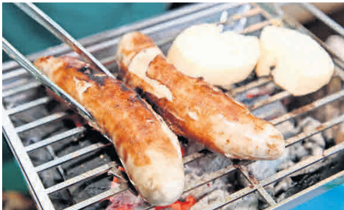
SOMMERZEIT IST PARTYZEIT: Im Altenburger Land locken viele Feste mit Bratwurst und kühlen Getränken.