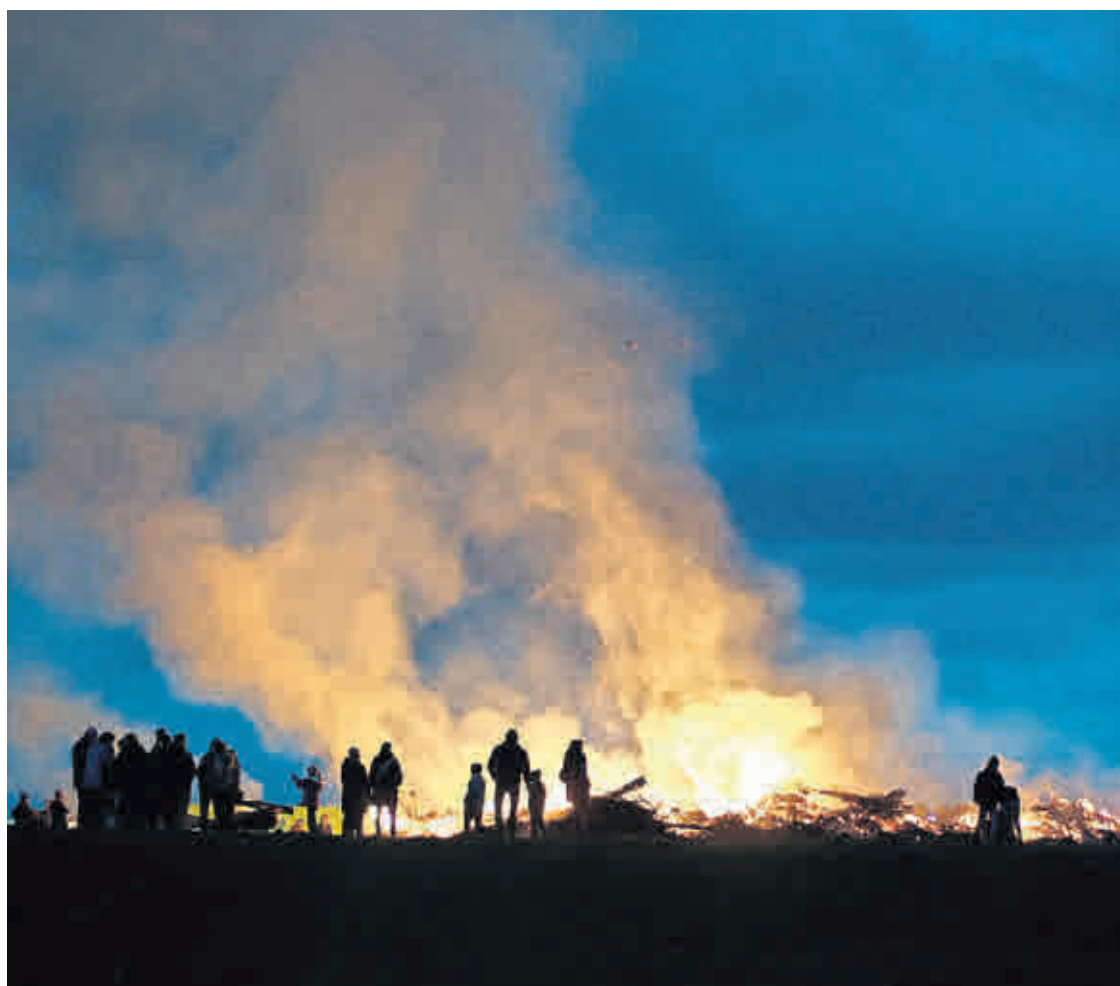
ZU OSTERN werden im Altenburger Land wieder zahlreiche Feuer abgebrannt.