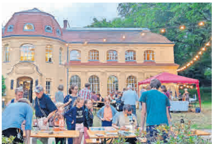
DIE MUSEUMSNACHT ALTENBURG lockt wieder Wissbegierige in verschiedene Museen des Landes.

Das RESERVIERUNGS- UND INFOTELEFON ist unter 03447 – 315851 zu erreichen. www.kulturhof-kosma.de