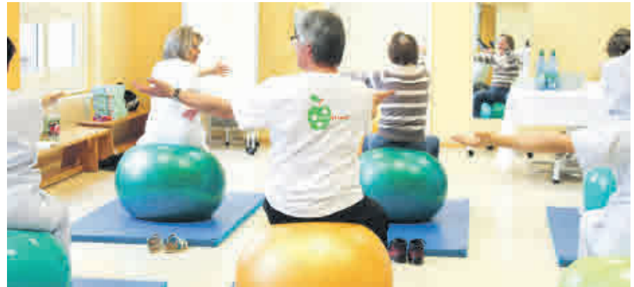
Zahlreiche Kurse der Klinik für Ambulante Rehabilitation luden zum Mitmachen ein. Die Wirbelsäulengymnastik und der Kurs zur Progressiven Muskelrelaxation begeisterten die Besucher.