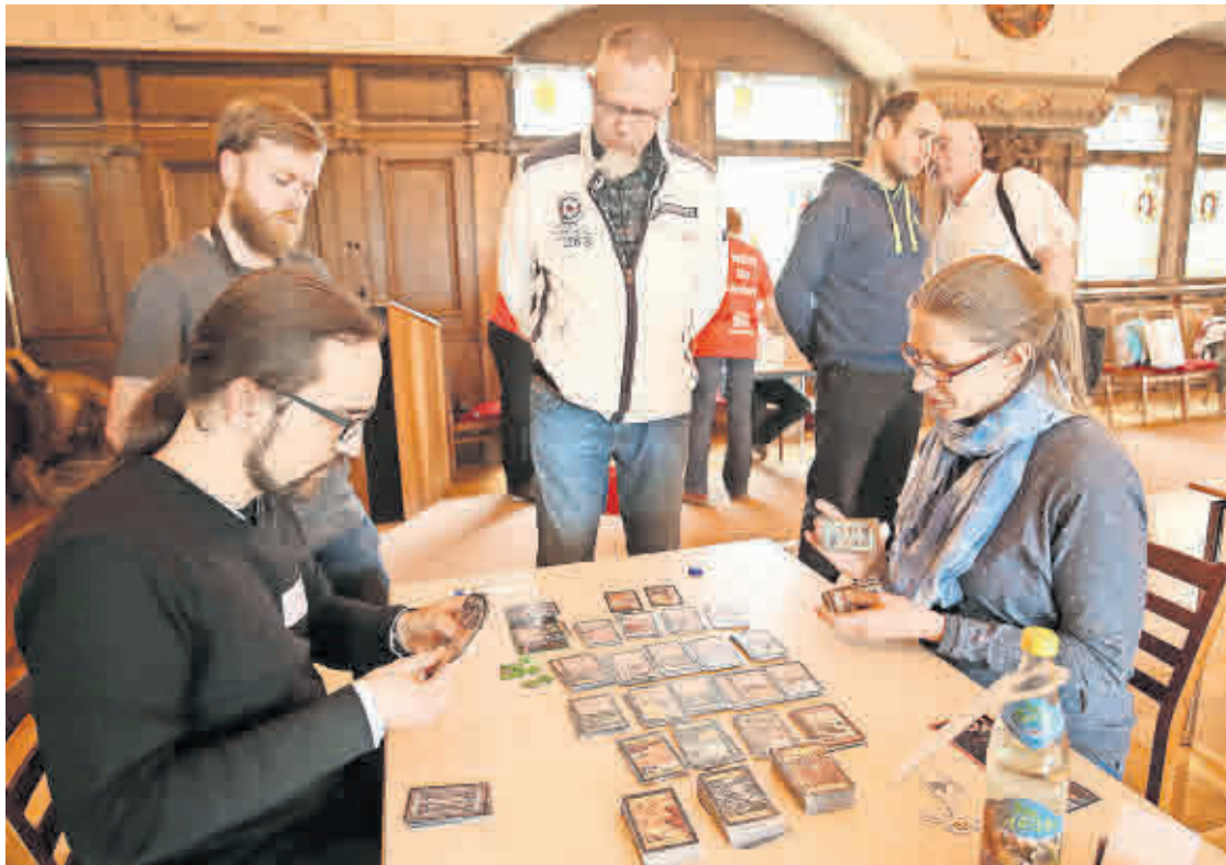
DAS SCHLOSS ALTENBURG ist wieder Schauplatz der Dominion-Meisterschaft.