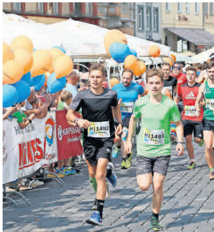
DER SKATSTADTMARATHON macht Altenburg Pfingsten wieder zum Mittelpunkt der Szene.

M it der 11. Auflage des Skatstadtmarathons am 8. Juni beginnt auch eine neue Ära der populären Laufveranstaltung: Das Organisationsteam ist seit Jahresende 2018 als Skatstadtmarathon Altenburg nun ein selbständiger Verein. Beste Voraussetzungen, das Sportlerfestival noch beliebter zu machen, als es ohnehin schon ist.