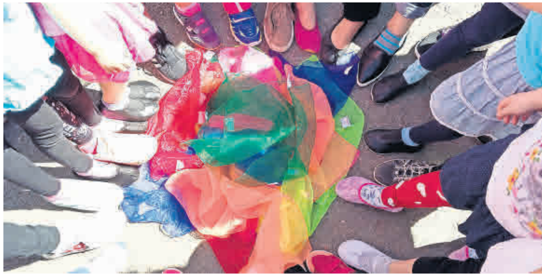
ZUM WELTTANZTAG soll der ganze Hauptmarkt tanzen, wenn Anja Losse und weitere Organisatoren fast zehn Tanzgruppen auftreten lassen.