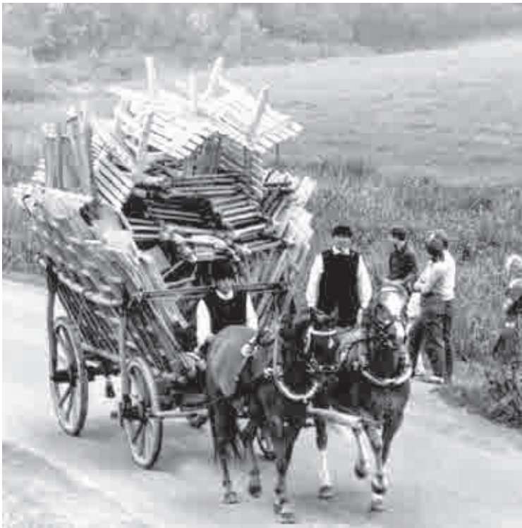
Leitermann als ambulanter Händler.

150 Jahre Leitermann GmbH: Der Bau-, Fach- und Gartenmarkt blickt auf seine Firmengeschichte zurück