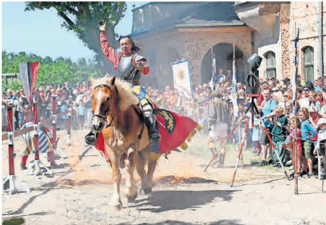
MITTELALTER-FANS freuen sich schon auf das Ritterspektakel vor der Burg Posterstein.

Ein kultureller Ausflug macht der ganzen Familie auch nach Engersdorf Spaß. Von Karfreitag bis Ostermontag findet dort täglich das „Österlicher Einerlei“ im Hinteruhlmansdorfer Komödiantenhof statt. Dabei werden verschiedene Stücke der historischen Marionettenbühne gezeigt.