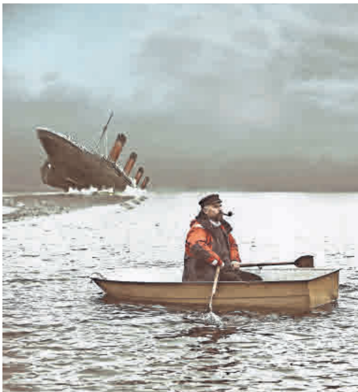
SPEKTAKEL VOR DER Theatersanierung: Der „Untergang der Titanic“ bezieht das Publikum mit ein.

Eine opulente Show ist das Ballett „Liberace - Glitzer, Schampus und Chopin“, das am 19. Mai Premiere feiert. Das schillernde und tragische Leben des Ausnahme-pianisten Liberace inspirierte Silvana