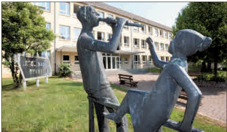
Schulgebäude des Lerchenberggymnasiums in Altenburg