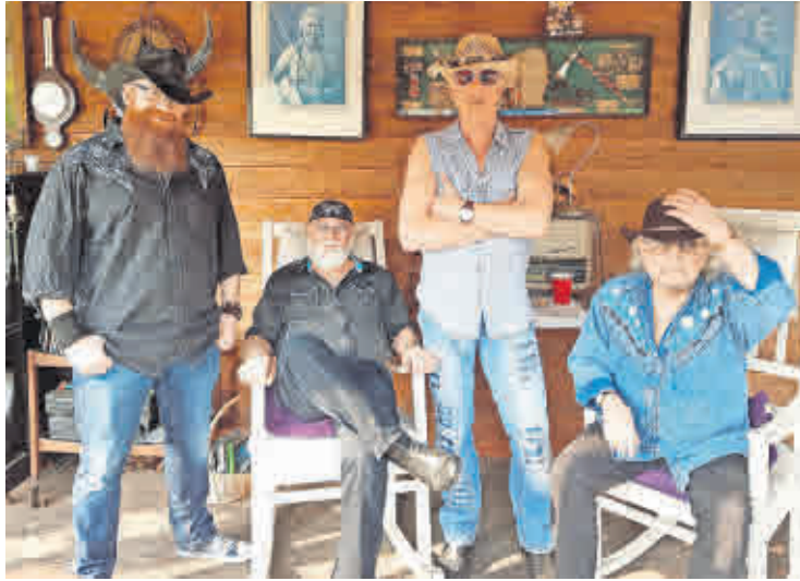
LASSEN DIE ORIGINAL-HITS von CCR wieder aufleben: CCRevived spielen im Schloss Hubertusburg Wermsdorf.

In einer Zeit, in der es das Smartphone noch nicht gab, aber viele einen Gameboy oder Walkman in der Hand hielten, feierten diese Stars ihre Erfolge. Was sie in den wilden 90er Jahren einte, war