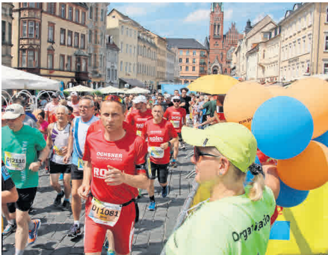
DER SKATSTADTMARATHON verspricht wieder jede Menge sportliche Spannung und Spaß am Rand der Strecke.