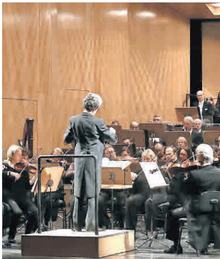
„KLINGT GUT!“ ist nur einer von vielen Terminen mit dem Philharmonischen Orchester Altenburg-Gera.