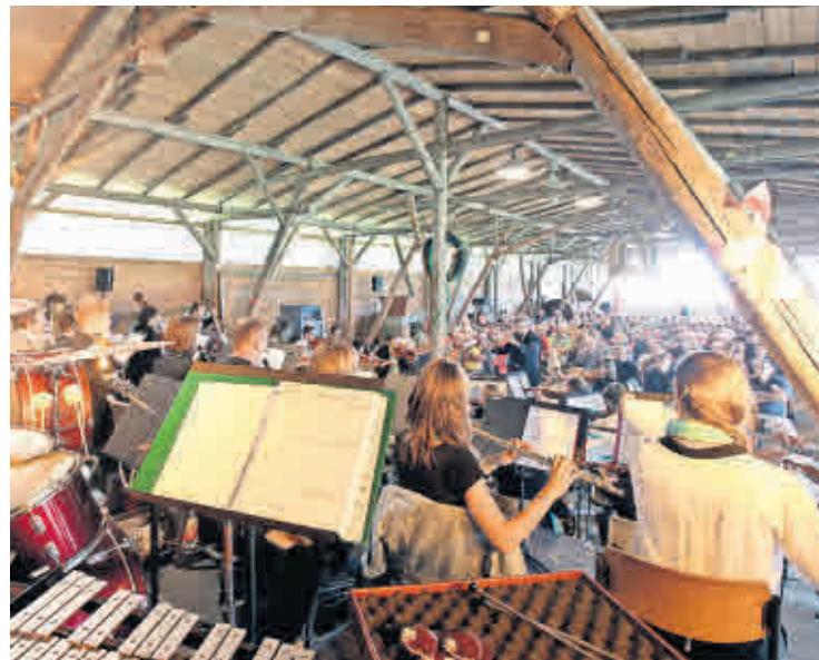
BEIM ALTENBURGER MUSIKFESTIVAL finden Konzerte auch an ungewöhnlichen Orten, wie der Bockwindmühle Lumpzig, statt.

Am Sonntag, 12. Mai, ab 16 Uhr gibt es im Schloss Altenburg im Bachsaal eine Konzertvorschau. Das Warm-up für das Musikfestival ist am Donnerstag, 8. August, geben Manuel Schmidt & Kollegen ab 20 Uhr in der Brauerei-Tenne. Danach geht es Schlag auf Schlag weiter, meistens mit mehreren Konzerten an den Nachmittagen und Abenden. Highlights? Alle! Ein bisschen aus dem Rahmen fallen auf jeden Fall das Open Air „Abba 4u“ – eine Hommage an die weltberühmte Pop-Band – am 15. August auf dem Rittergut Treben und Die Nixen am 14. August im Teehaus Schloss Altenburg. Das junge Streichquartett macht einen Ausflug durch Filmmusiken, Jazz, Pop und Rock.