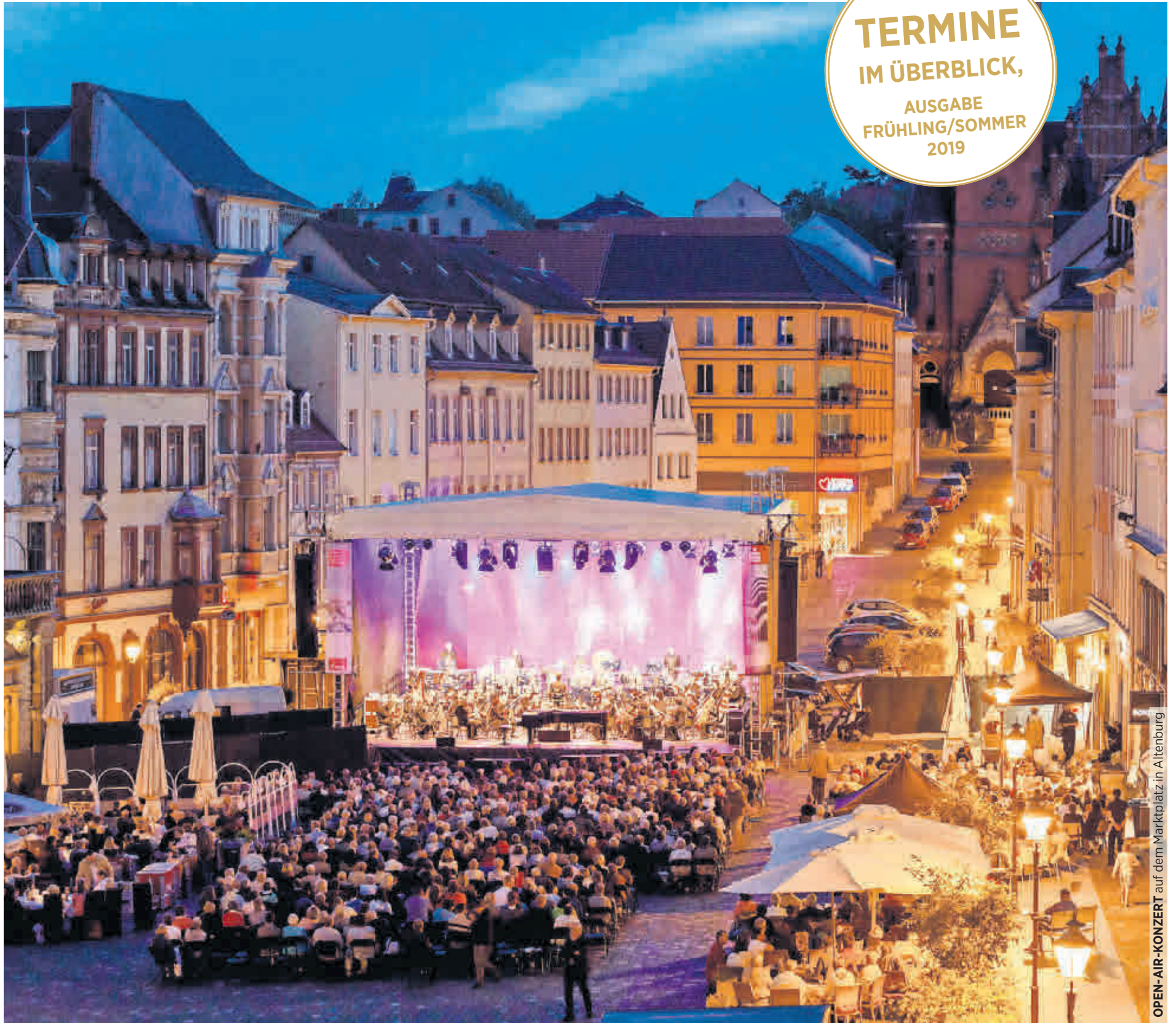
OPEN-AIR-KONZERT auf dem Marktplatz in Altenburg

TERMINE IM ÜBERBLICK, AUSGABE FRÜHLING/SOMMER 2019