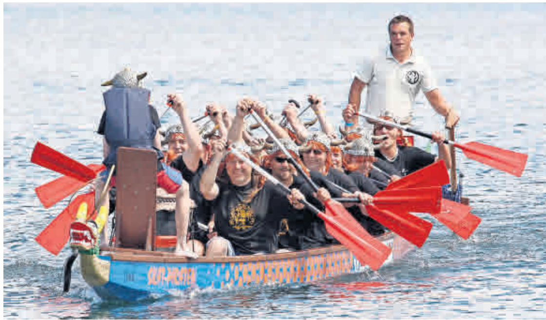
SO LANGSAM DARAN denken: Für das Drachenbootrennen in Wintersdorf am Haselbacher See am 22. Juni müssen sich die Teams anmelden. Ein Formular gibt es auf der Website des Vereins Aqua Fun Wintersdorf.