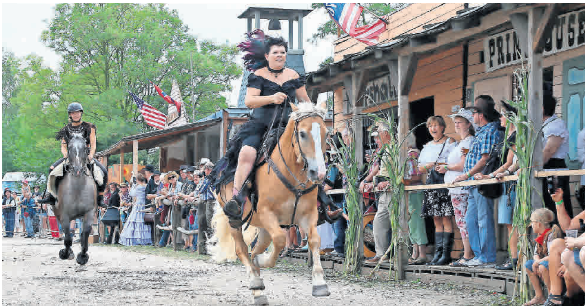
TRADITIONELLER TERMIN für Freizeitcowboys: Die Westerntage in der Westernstadt Haselbach.