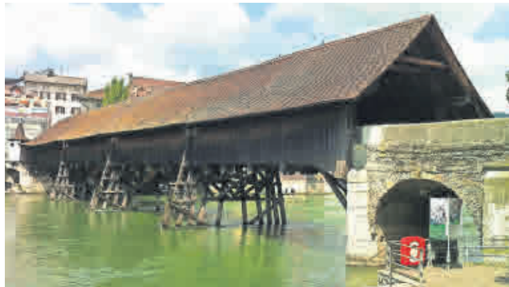
Aus dem malerischen Olten kommen ebenfalls Gäste, um die Städtepartnerschaft mit Altenburg zu feiern.

Altenburg. Wie praktisch, dass am gleichen Tag (und tags zuvor) das Klassik Open Air stattfindet. Denn so steht die Bühne schon bereit.