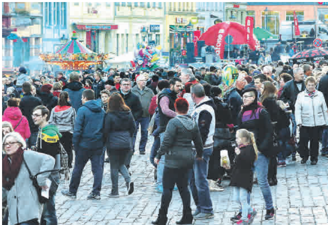
Zur Frühlingsnacht in Altenburg tummeln sich jedes Jahr zahlreiche Besucher in der Stadt.

Alpenveilchen mit Tannengrün - Frauentag 2018, Gratulation