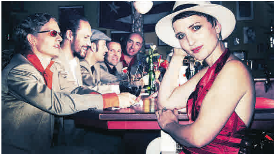
Würze, Charme und Authentizität verspricht der Auftritt von „Tumba-ito“. Die Gruppe gastiert am 16. August im Rittergut Treben. Auf dem Programm: Latin music.

Der Knabenchor Dresden, das Familienkonzert von OVZ und Förderverein Altenburger Musikfestival, das Ensemble „4 Times Baroque“, die Cellisten von