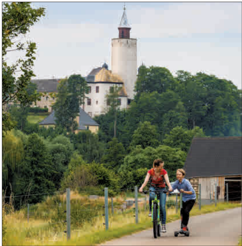
Der ländliche Raum (hier: Blick auf Burg Posterstein) hat vor allem Lebensqualität zu bieten. In der Kategorie Schloss der Landkreis am besten ab.

Altenburg. Das Nachrichtenmagazin „Focus“ hat in seiner Ausgabe vom 10. Februar alle 401 Landkreise der Bundesrepublik unter die Lupe genommen und Platzierungen vergeben. Bewertet wurden die Landkreise nach fünf verschiedenen Kriterien: Wachstum und Jobs, Firmengründungen, Produktivität und Standortkosten, Einkommen und Attraktivität sowie Lebensqualität. Das Altenburger Land findet sich demnach auf Rang 348 wieder. Im Vergleich zum Fokus-Ranking des Jahres 2015 macht der Landkreis damit einen deutlichen Satz nach vorn, denn er lag noch vor drei Jahren auf dem vorletzten Platz 401.