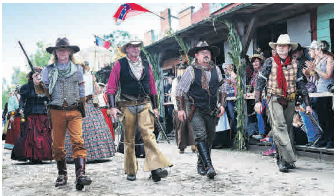
Die Westertage Haselbach lassen den Wilden Westen wieder auferstehen.

Altenburger Musikfestival 2018, Festsaal Schloss, Altenburg, traditionelle Opern- und Abschlussgala präsentiert vom