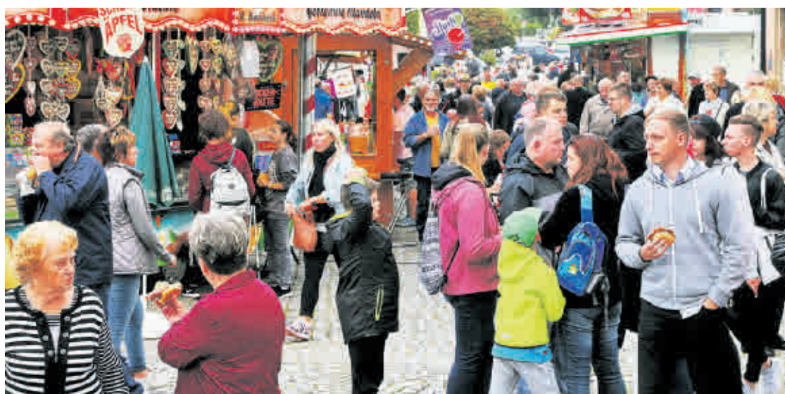
Das Stadtfest Meuselwitz lockt mit Kultur und leckeren Schlemmereien viele Besucher an.