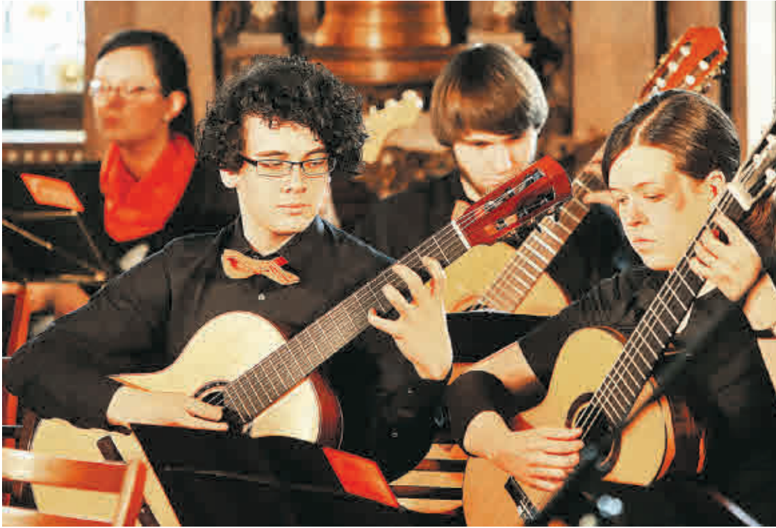
Das Landesjugendzupforchester ist erneut beim Altenburger Musikfestival vertreten.