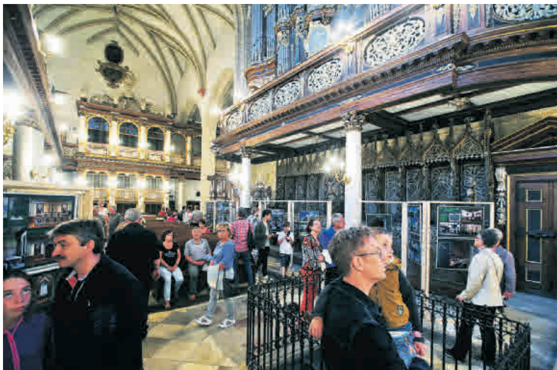
Die Schlosskirche zog in der Vergangenheit interessierte Besucher der Museumsnacht an.

Konzert in der Kirche J. S. Bach: „Erfreut euch, ihr Herzen“ Evang.-Luther. Kirchgemeinde, Brüderkirche