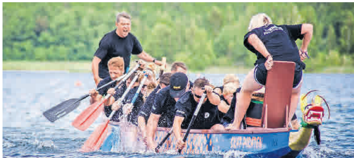
Sie geben alles für ihr Team: Beim Drachenbootfestival trifft Wettbewerb auf Spaß.