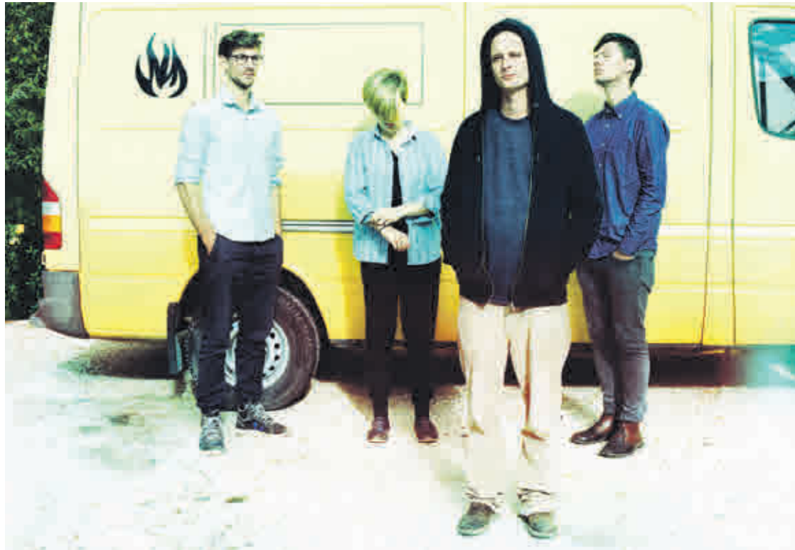
Kaum ein Bart in Sicht, und doch: „Weird Beard“ sind am 13. April im Jazzklub Altenburg zu Gast.

Karfreitagsfahrt mit der Kohlebahn unterwegs in Thüringen und Sachsen Kohlebahnverein Meuselwitz, Kulturbahnhof, Georgenstraße 46