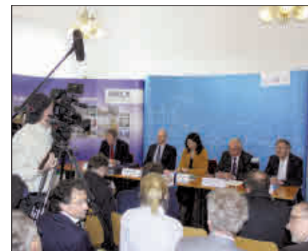
Pressekonferenz in Rositz mit Umweltministerin Anja Siegesmund

Ein Hochwasser im Jahr 2002 spülte erstmals Schadstoffe des