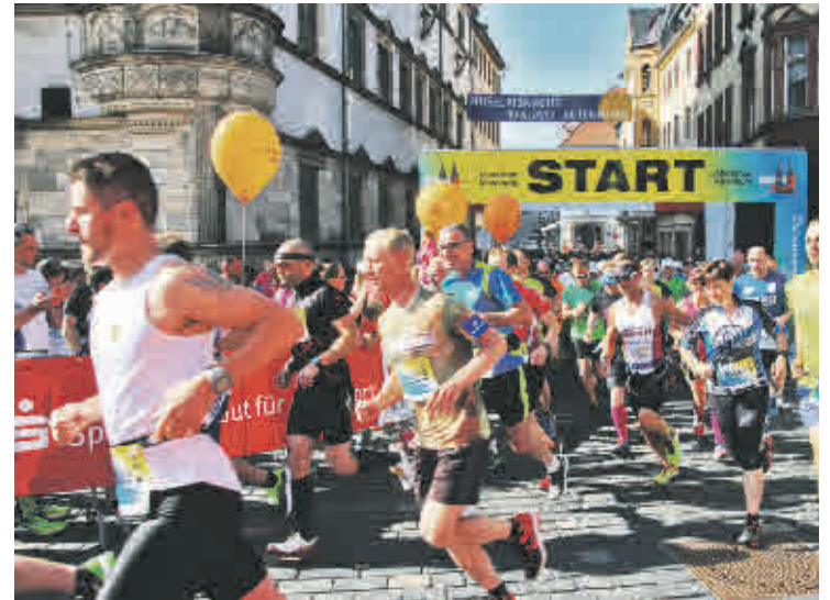
Ob Volks- oder Spitzensportler – sie alle eint die Freude an der Bewegung.