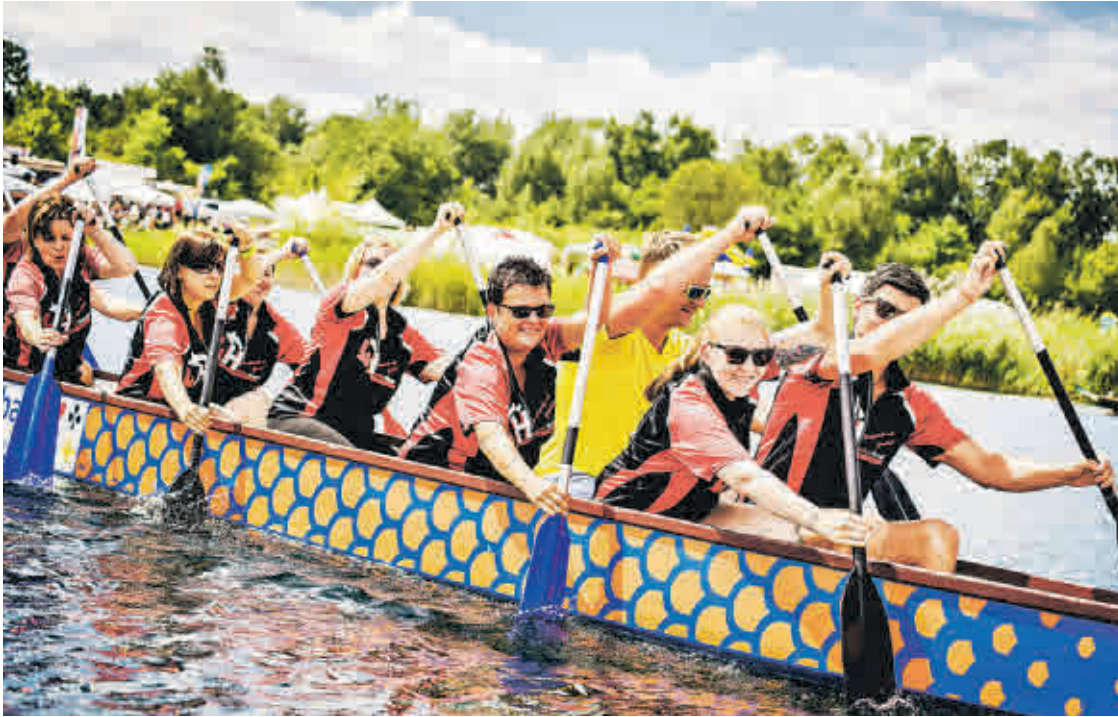
Das Drachenbootfestival lockt seit Jahren zum Haselbacher See.