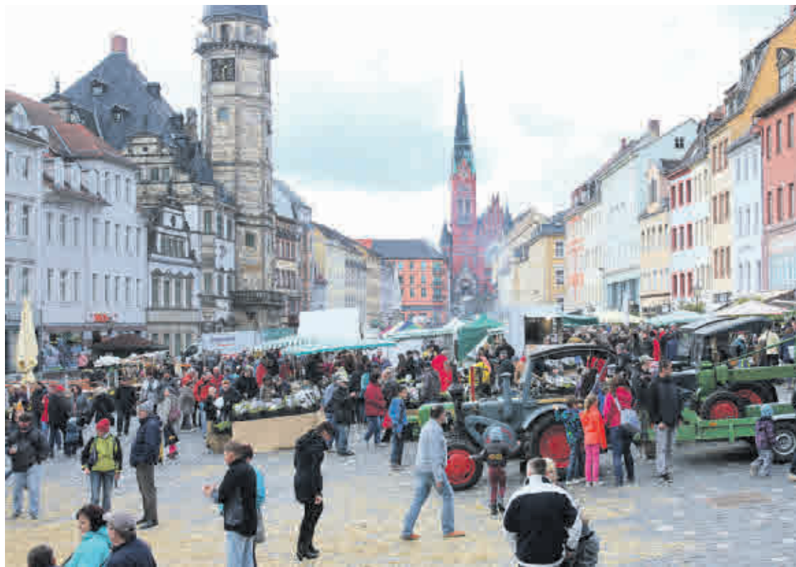
Stets eine beliebte Anlaufstelle: der Bauernmarkt auf dem Altenburger Marktplatz.