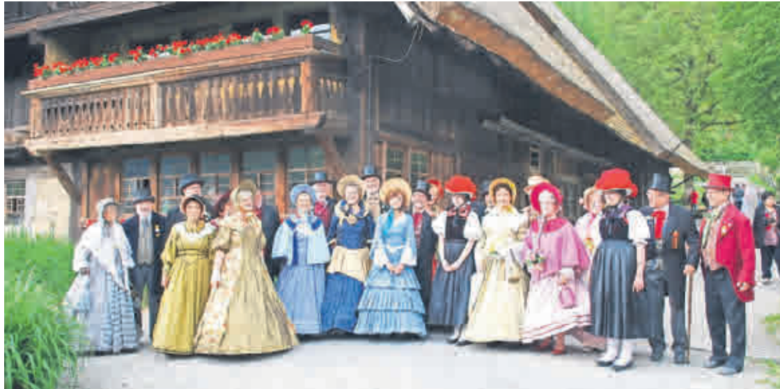
Ein Hauch 19. Jahrhundert in Altenburg: Die Biedermeiergruppe aus Offenburg wird zum Bürgerfest nicht nur zeitgemäße Kostüme, sondern auch Tänze und Lieder präsentieren.

Skatstadt feiert Städtepartnerschaften mit Offenburg und Olten