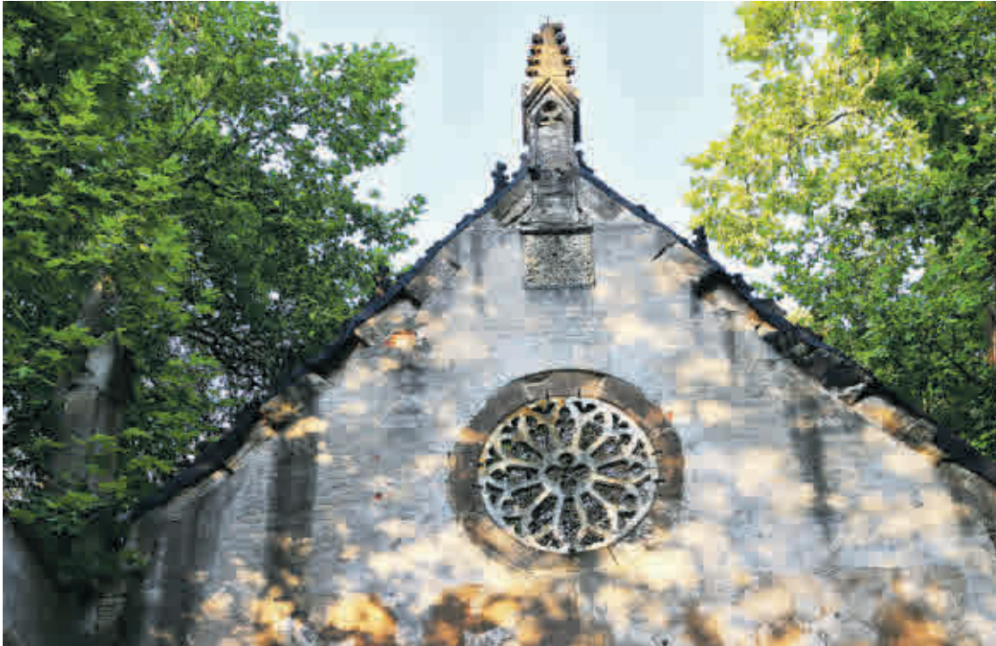
Fürstengruft und Krematorium werden bei den beliebten Friedhofsführungen besucht.