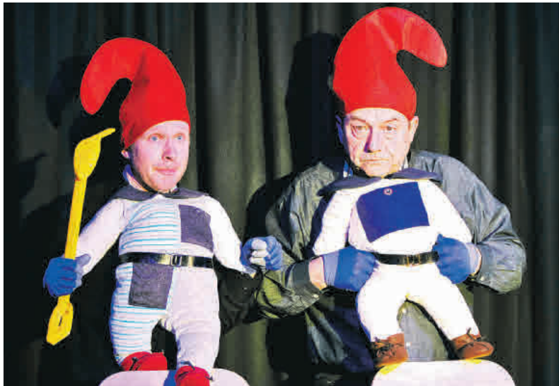
„Rad ab, oder was?“ fragen die Nörgelsäcke in einem ihrer aktuellen Programme.

Mini-Prinzenraubfestspiele, Förderverein Altenburger Prinzenraub e.V. Altenburger Schloss, Agnesgarten