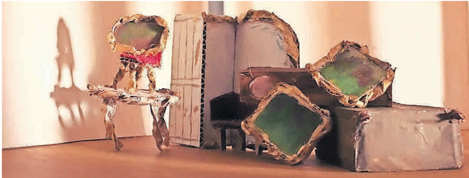
„Intrige im Goldsaal“ heißt es ab 19. Mai im Residenzschloss Altenburg. Die Ausstellung gilt als Highlight des Jahres.