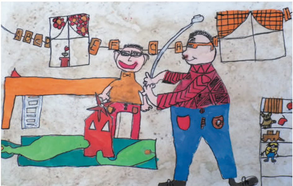
Enke, 10 Jahre