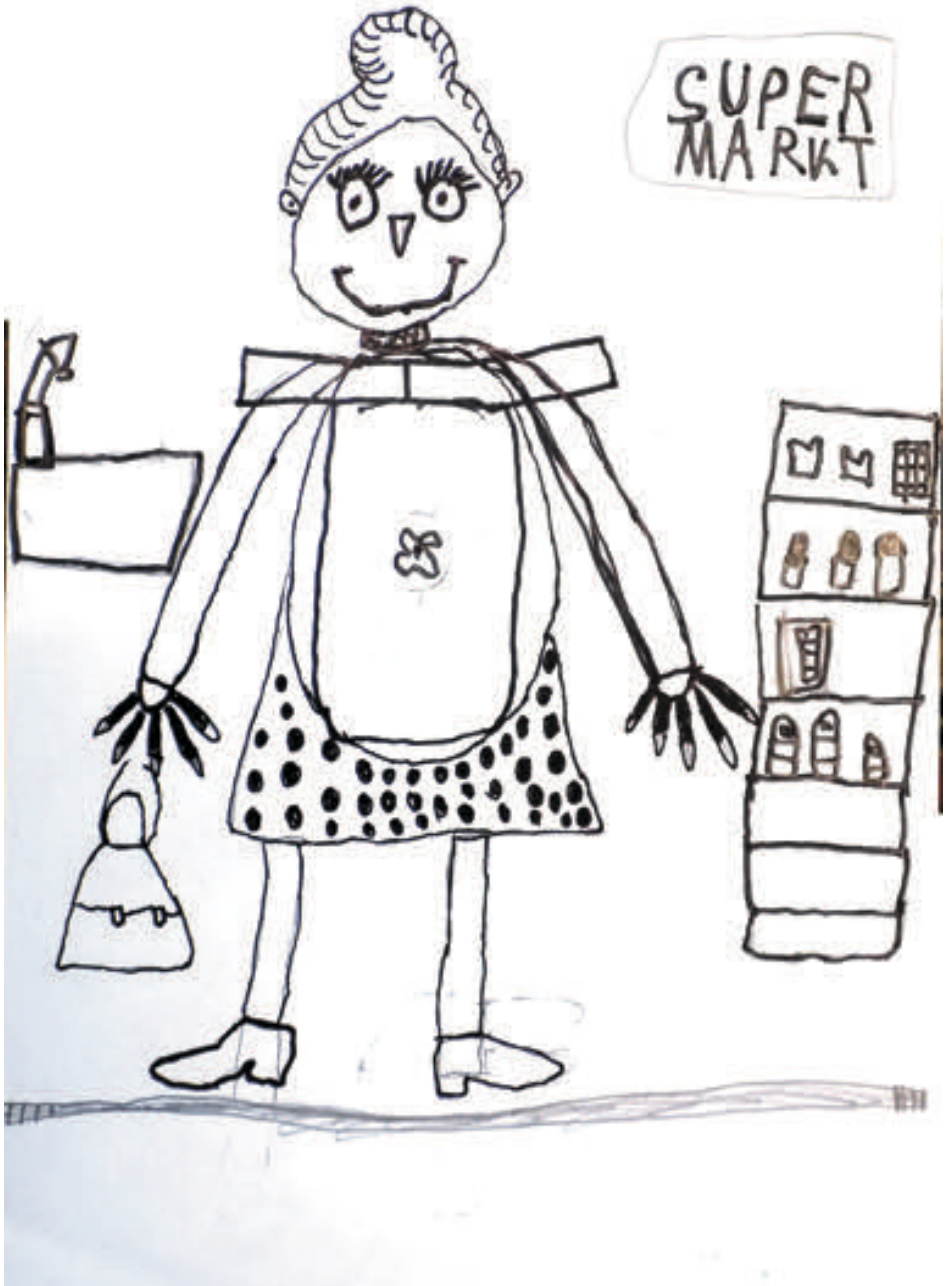
Saskia, 6 Jahre