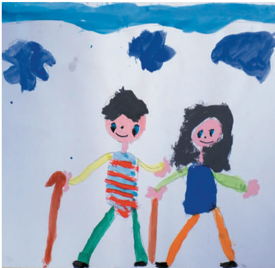
Luisa, 6 Jahre