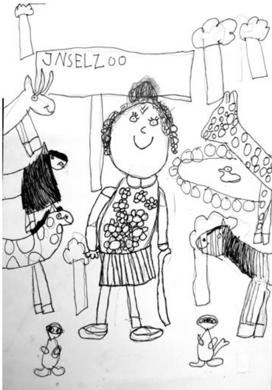
Leni, 6 Jahre