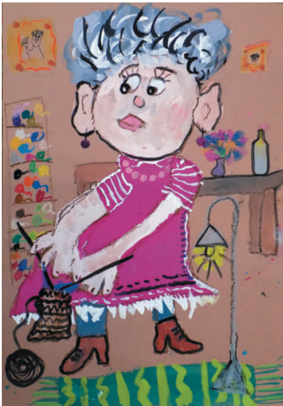
Tessa, 6 Jahre