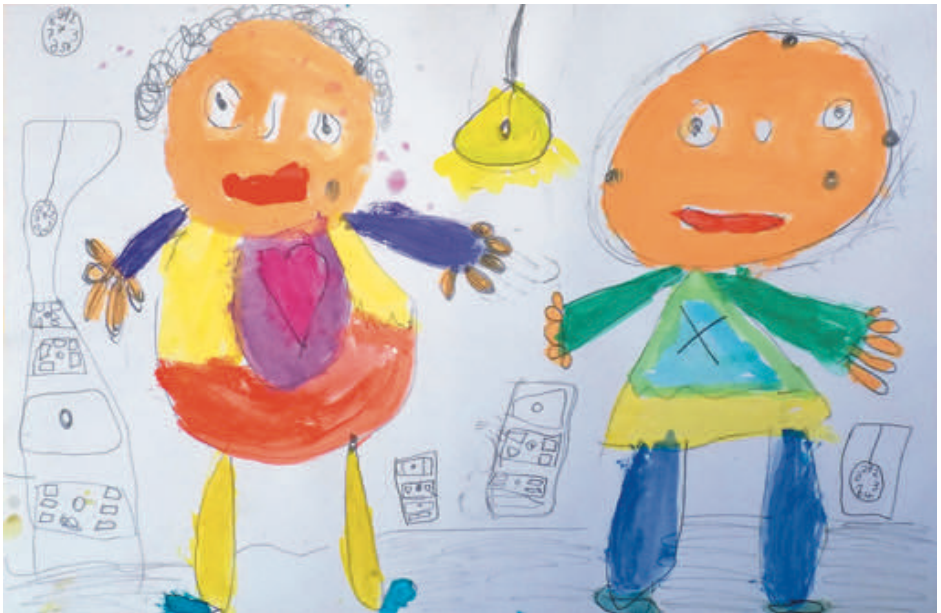
Elsa, 6 Jahre