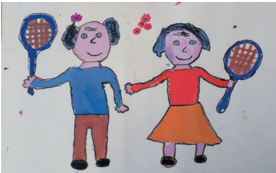
Theres, 11 Jahre

Die Volkshochschule kann Sie auch über seniorengerechte Sport- und Gesundheitsangebote informieren.