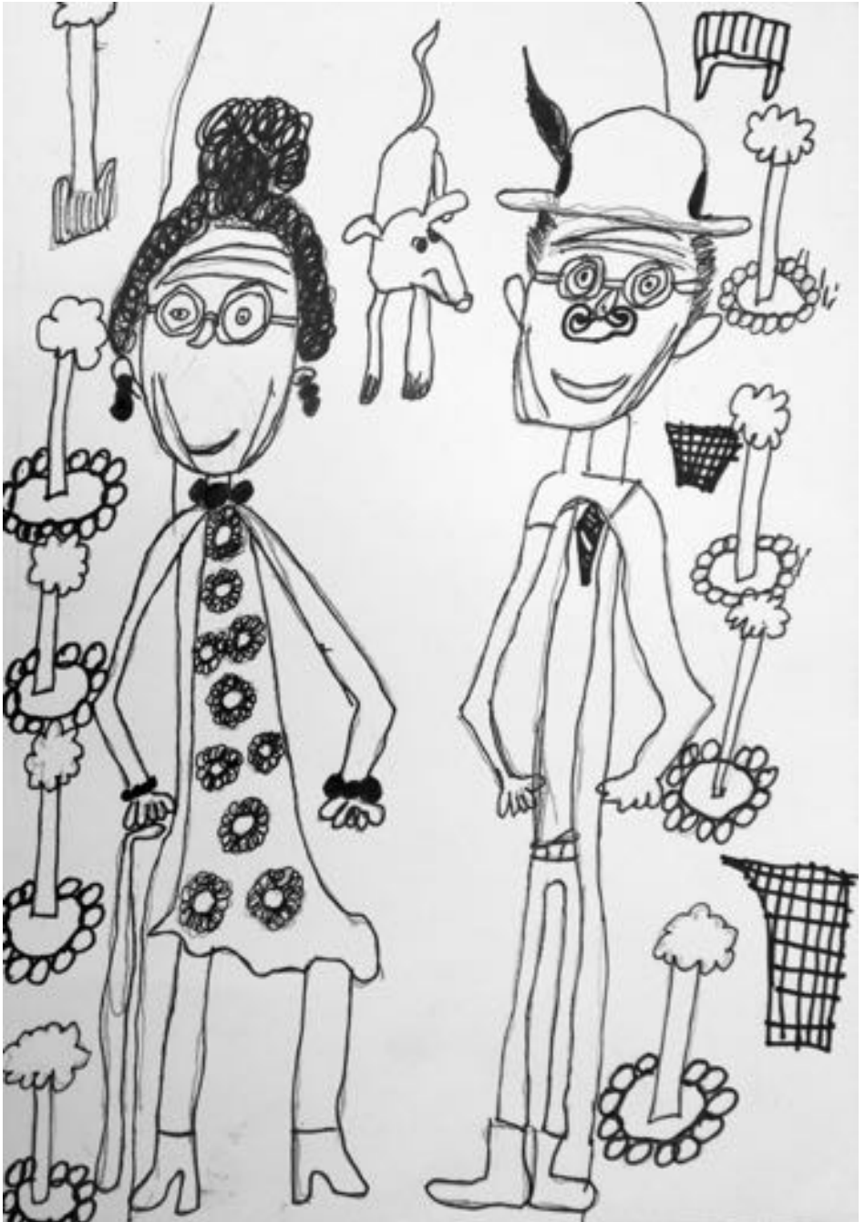
Merle, 7 Jahre