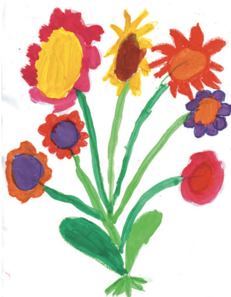
Elsa, 7 Jahre