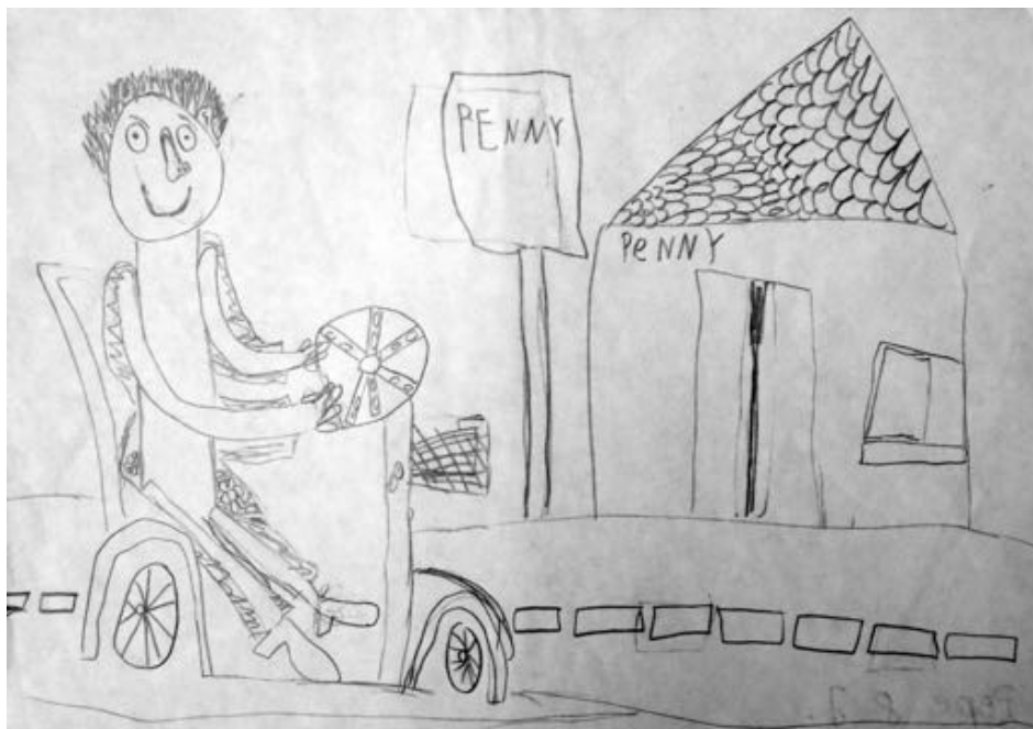
Pepe, 8 Jahre