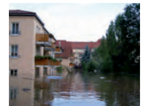
Hochwasser in der Stadt