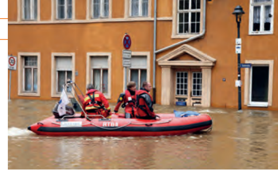
Rettungshelfer beim Hochwasser in Halle, Sachsen-Anhalt, 2013