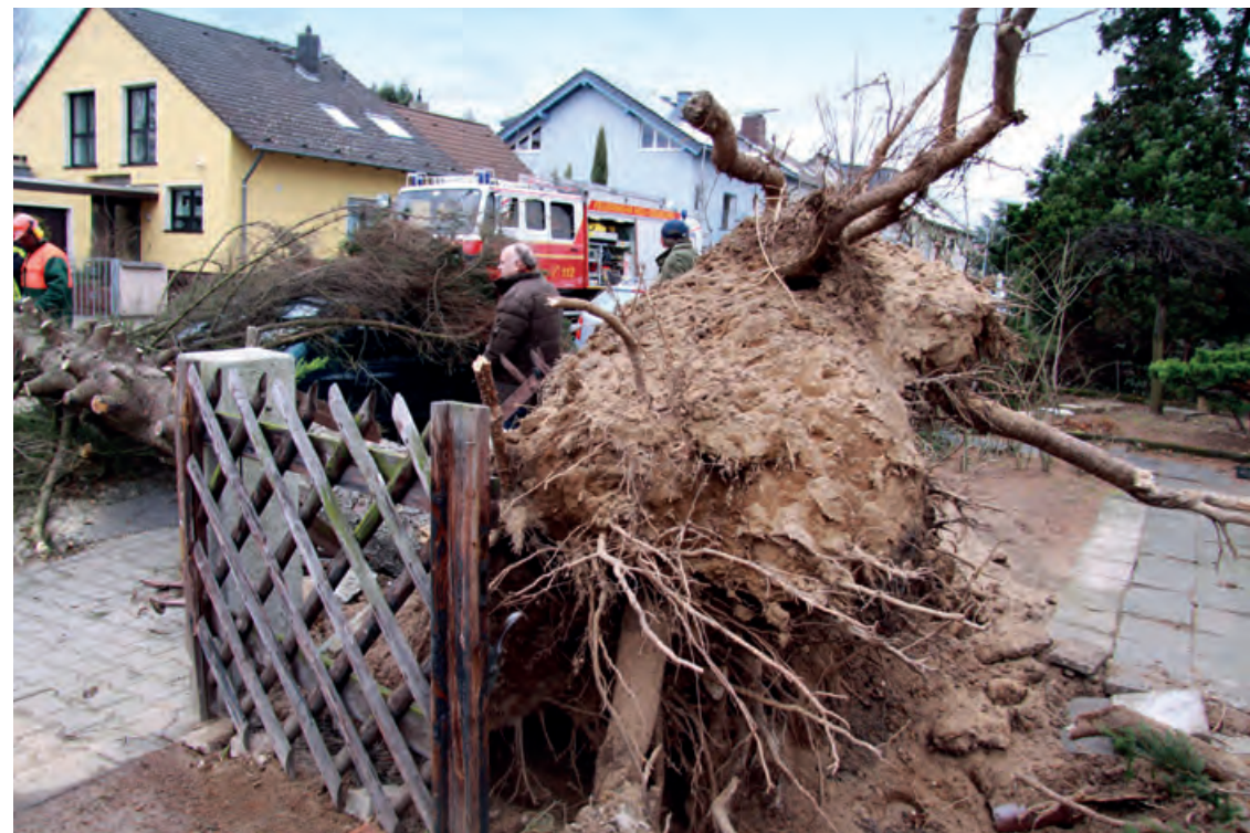
Sturmtief Xynthia sorgte in Hessen für gefährliche Orkanböen, 2010