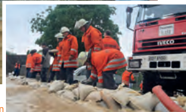
Schutzwälle aus Sandsäcken