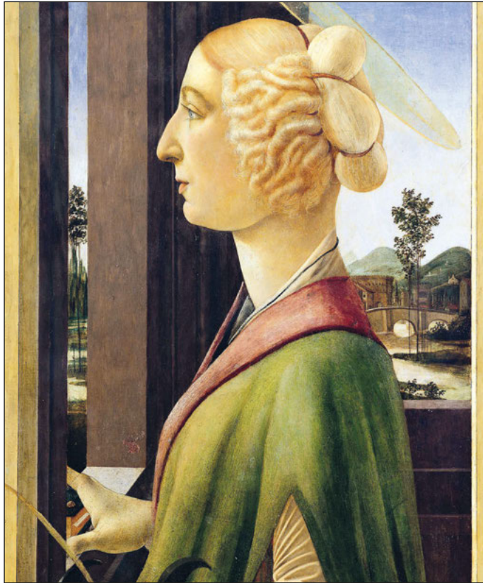
Gerade in San Francisco: Sandro Botticelli, Bildnis einer Dame (um 1475, Lindenau-Museum Altenburg).

Ausgerechnet nach Italien – in die Heimat der Tafelmalereien des Lindenau-Museums – wurde 2023 ein Werk der klassischen Moderne verliehen: Im Palazzo Pitti der Uffizien in Florenz war das Landschaftsbild „Procida“ (1939) aus dem Bestand des Lindenau-Museums von Rudolf Levy zu sehen. Anlass war eine große Retrospektive zu Ehren des expressionistischen Künstlers, der 1940 nach Florenz emigrierte. Die Uffizien gelten zusammen mit dem Kolosseum in Rom, den Vatikanischen Museen und den Ausgrabungsstätten von Pompeji als die bedeutendsten Kulturstätten Italiens.