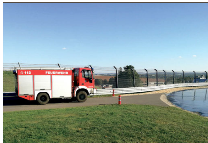
Trainiert wurde auch auf nasser Fahrbahn.

Zum Training vor Ort im Verkehrssicherheitszentrum auf