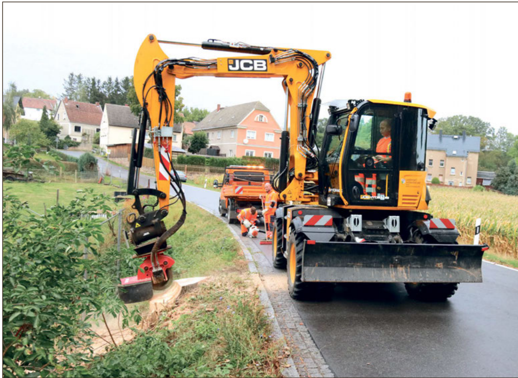
Die Mitarbeiter der Kreisstraßenmeisterei kümmern sich im Herbst unter anderem um die Pflege der Gehölze am Straßenrand.