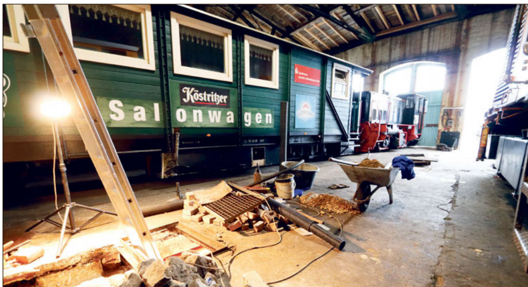
Mit LEADER-Fördermitteln kann unter anderem auf dem Kohlebahnhof in Meuselwitz die Wasserversorgung für den Einsatz einer Dampflok wieder ertüchtigt werden.

Darüber hinaus sollen die Themenfelder Kooperation und Vernetzung, Innovation, Teilhabe und Inklusion sowie Jugendbeteiligung gefördert werden.