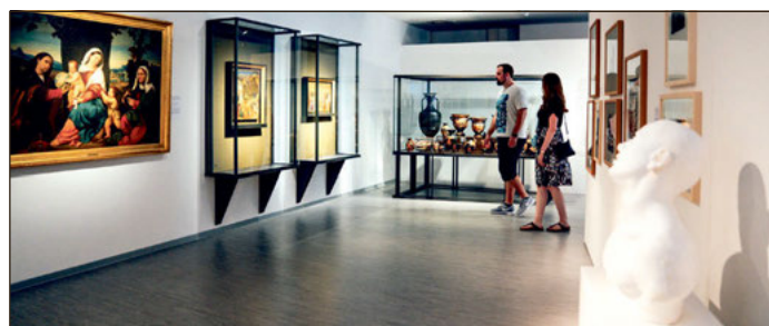
Im Lindenau-Museum kann Kunst in der Stadt betrachtet werden.

turentwicklungsprozess ein familienfreundliches Reiseziel im mitteldeutschen Raum beworben. „Es ist zusammen mit unseren Partnern gelungen, den Tourismus durch zwei schwere Jahre zu führen. Um die positive Entwicklung fortzusetzen, stellt sich der Tourismusverband zukunftsfähig auf und treibt Themen wie Quali-