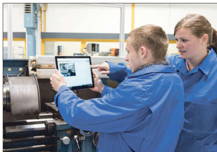
Zu moderner Ausbildung gehören heute auch digitale Medien.