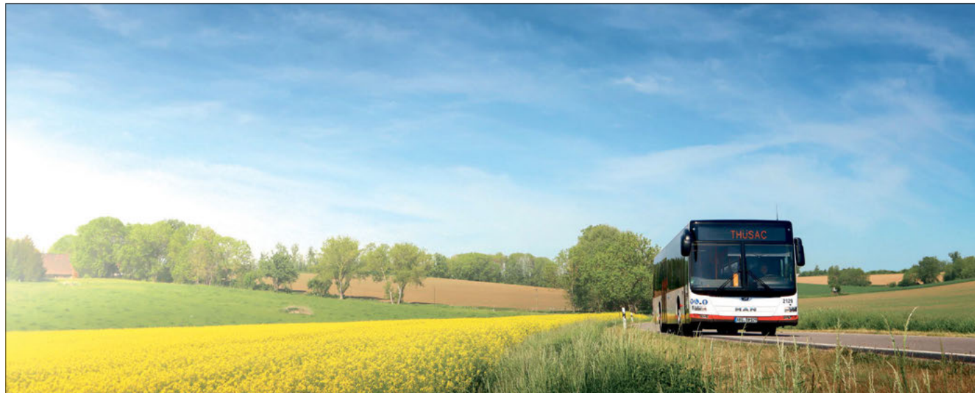
Ein Niederflerbus der THÜSAC auf seiner Route durch das nördliche Altenburger Land.

Verkehrsunternehmen geht mit „Regionalverkehr verbindet – Mobilität für das Altenburger Land“ seit Dezember neue Wege