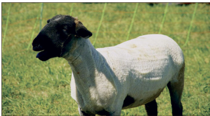
Hausschafressen wie die Suffolks müssen im Frühjahr geschoren werden.

Altenburg. Die Zahl der Schafe im Landkreis Altenburger Land steigt seit einiger Zeit wieder an. Deshalb weist Amtstierärztin Grit Thureau noch einmal darauf hin, dass für die Gesundheit der Tiere eine Schur unerlässlich ist. „Ich möchte alle Schafhalter eindringlich daran erinnern, jetzt, wenn Temperaturen steigen, muss die Wolle runter“, betont Thureau.