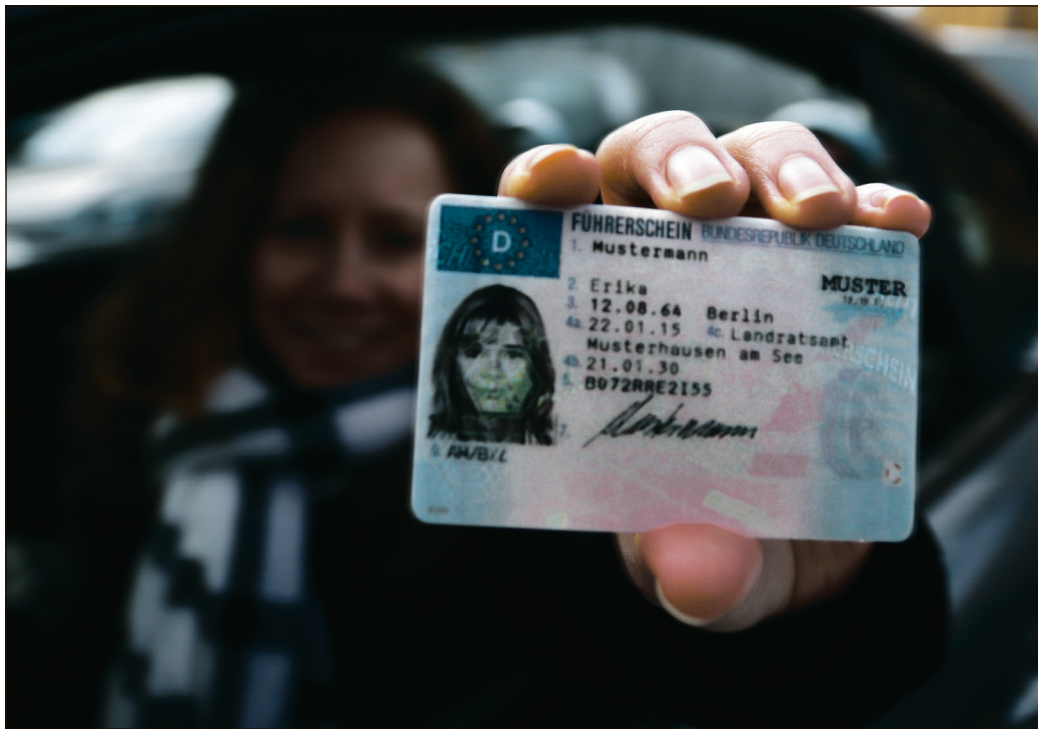
Wer den alten „Lappen“ noch hat, bekommt jetzt einen EU-Kartenführerschein.

Um seinen Führerschein umtauschen zu können, ist eine vorherige Terminabsprache beim Landratsamt erforderlich.