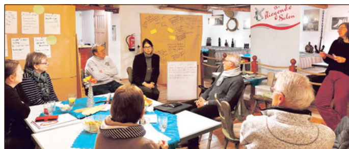
„Der fliegende Salon“ sammelt in der Altenburger Sparte Alexander Puschkin Ideen für die Zukunft im Kleingartenwesen.

bürgerlichen Engagements, Ort für ökologischen Anbau von Obst und Gemüse, für Umwelt- und Naturschutz bis hin zum Ort für soziokulturelles Zusammensein. Für die Planung und Umsetzung des Programms werden weitere Ideengeber und Mitstreiter mit Begeisterung für Garten, Natur und Kultur gesucht.