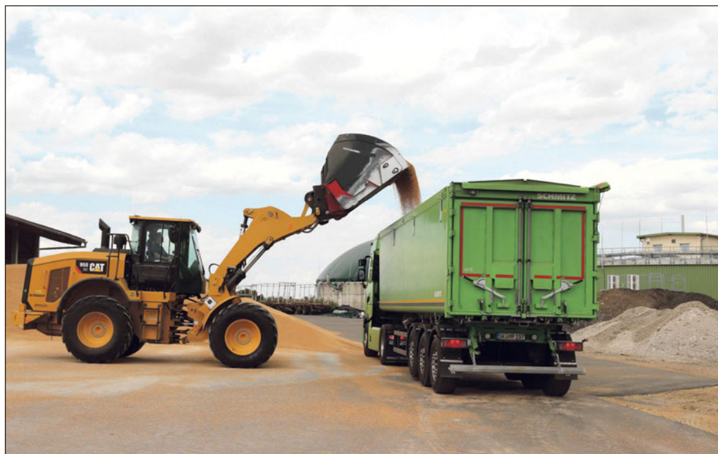
Getreideproduktion, Biogas und Abfallrecycling – landwirtschaftliche Betriebe im Altenburger Land sind wie hier in Göhren bereits in der Bioökonomie tätig.