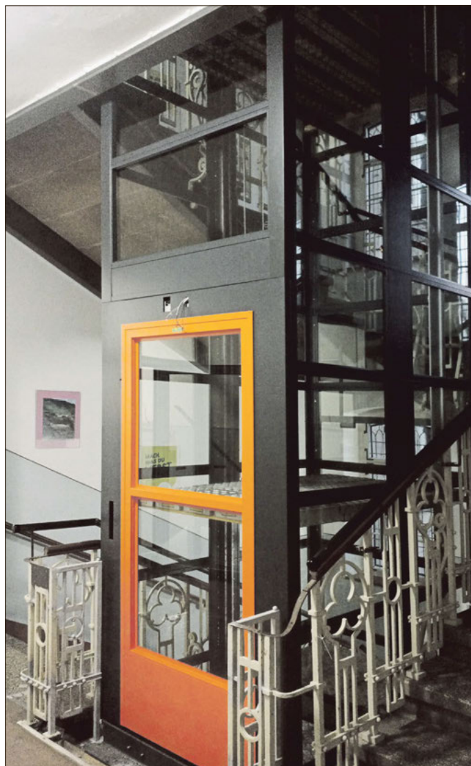
Der neue Aufzug in der Volkshochschule kann bald in Betrieb genommen werden.

Nach aufwendigen Vorbereitungen wie Fundamentarbeiten, Herstellung eines Deckendurchbruches zwischen Kellergeschoss und Erdgeschoss, Montage der Stahlunterkonstruktion und verschiedenen Umbauarbeiten hinsichtlich Heizung, Sanitär und Elektroinstallation konnte zum Jahresende der Personenaufzug eingebaut werden. Hier sind die Monteure gerade noch mit letzten kleineren Restarbeiten beschäftigt. Fertig installiert ist eine neue Brandmeldeanlage im gesamten Haus und auch ein behindertengerechtes WC wurde im Erdgeschoss neu geschaffen.